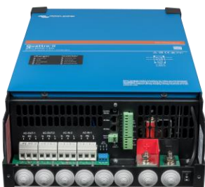
Zona de conexión del Quattro-II 48/5k